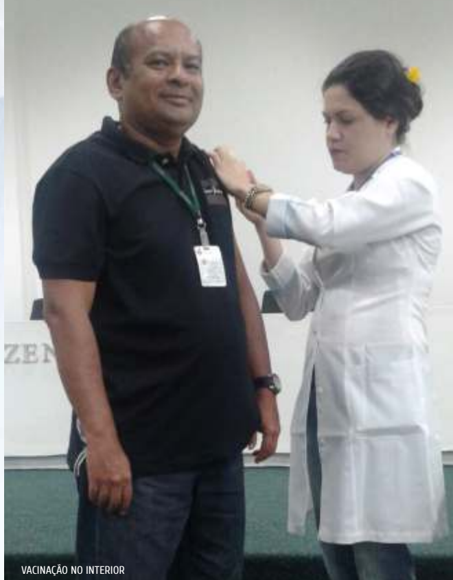
VACINAÇÃO NO INTERIOR

A CAFAZ iniciou em maio/junho de 2015, em parceria com a Secretaria da Saúde do Estado, a Campanha de Vacinação contra a gripe e o sarampo, cujo slogan é "Sua saúde, nosso cuidado". As atividades fazem parte do calendário das Ações em Saúde desenvolvidas pelo Programa de Gerenciamento em Saúde (PGS). Durante esse período, a equipe de profissionais da CAFAZ visitou as unidades da Sefaz da capital e do interior para realizar a vacinação. Também foi disponibilizado posto fixo na sede da CAFAZ.