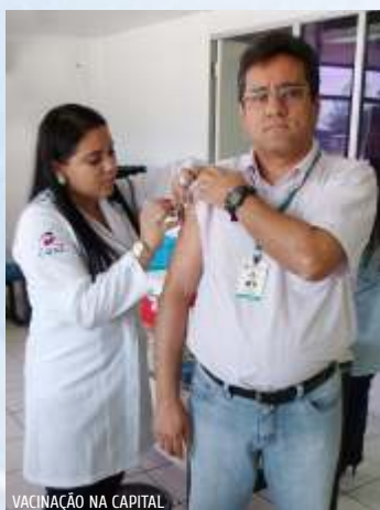
VACINAÇÃO NA CAPITAL

ligue para a CAFAZ – Atendimento (85) 3101.2636 atendimento@cafaz.org.br